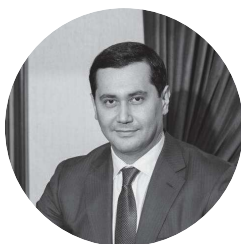
On. Sardor Umurzakov Vice Premier Ministro degli Investimenti e del Commercio Estero

Il Ministero degli Affari Esteri e della Cooperazione Internazionale promuove il Business Forum Italia-Uzbekistan , un'iniziativa interamente digitale che mira a rafforzare la conoscenza tra i due paesi al fine di incentivare la cooperazione ed il partenariato bilaterale.