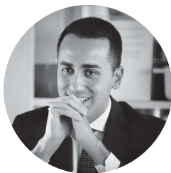
On. Luigi Di Maio Ministro degli Affari Esteri e della Cooperazione Internazionale